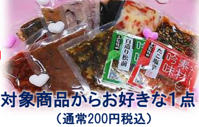
対象商品からお好きな1点 (通常200円税込)