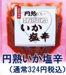
円熟いか塩辛 (通常324円税込)

甘い物が苦手な方へ ご飯やお酒に ぴったりの生鮮珍味の プレゼントは いかがですか？