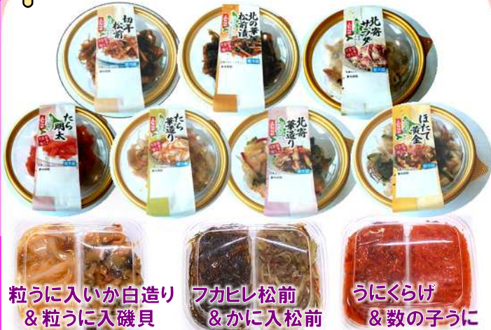
粒うに入いか白造り & 粒うに入磯貝 フカヒレ松前 & かに入松前 うにくらげ & 数の子うに

バレンタイン用 丸カップ(全7種)・ラッピングもできます プチ盛りセット(全3種) (各1個 378円税込) よいどい3個 1,000円(税込)