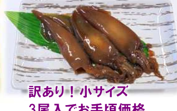
訳あり！小サイズ 3尾入でお手頃価格 やっぴいか沖漬