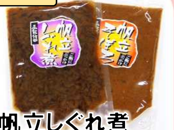
帆立しぐれ煮 帆立そぼろ